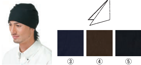
三角巾 ③ ④ ⑤