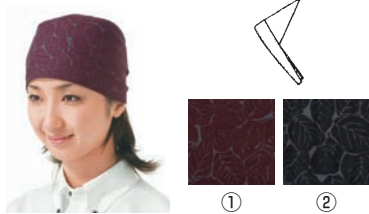
三角巾 ① ②