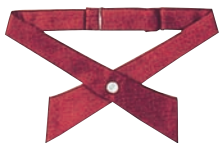
⑨クロスタイ JX4830-2 ワイン ⑨