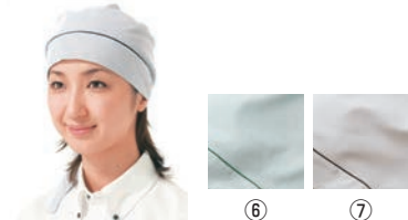
三角巾 ⑥ ⑦