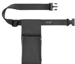
⑪ワーキングホルダー 1P ⑪